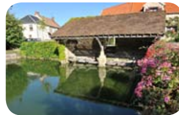
Lavoir de Villeziers